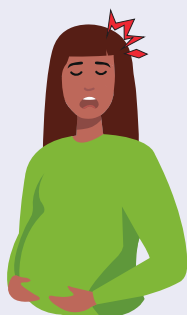
Mal de tête