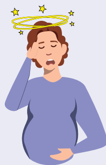
Perte de connaissance

Ces symptômes, surtout s'ils apparaissent dans un même lieu ou chez plusieurs personnes vivant ensemble doivent faire penser à une intoxication au monoxyde de carbone.