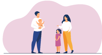
Futurs et jeunes parents par le biais des professionnels de santé