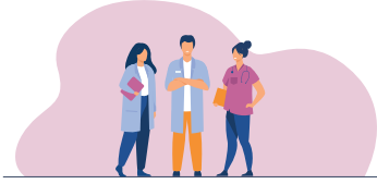
Professionnels de la périnatalité et de la santé