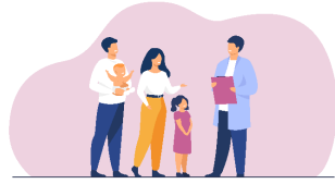
Futurs et jeunes parents